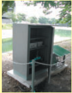
ตู้ที่นำไปติดตั้งตามแหล่งน้ำต่างๆ