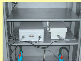
ชุดควบคุมการวัด และวงจรแปลงสัญญาณ