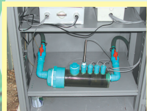
ชุดเก็บหัววัด