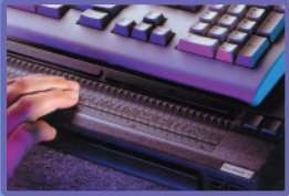
เครื่องแสดงผลอักษรเบรลล์ สำหรับคอมพิวเตอร์