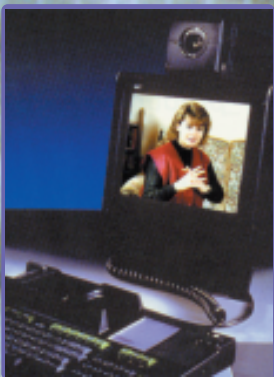
โทรศัพท์ข้อความสำหรับคนหูหนวก