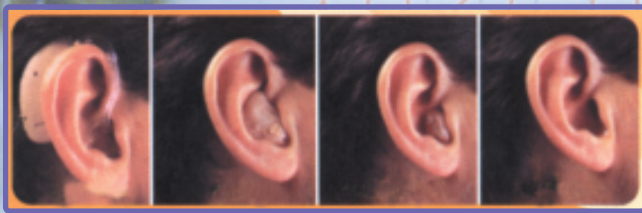
แบบคล้องหู แบบใบหู แบบใบหู (MINI) แบบซ่อนเร้น