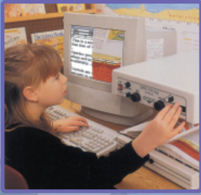
อุปกรณ์ขยายภาพ สำหรับคนสายตาเลือนลาง