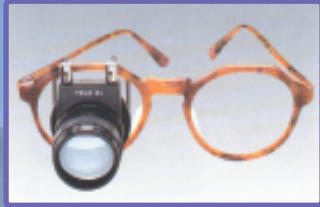
เลนส์ขยายภาพ สำหรับคนสายตาเลือนลาง