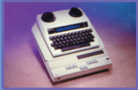
โทรศัพท์ข้อความอักษรเบรลล์ สำหรับคนหูหนวกและตาบอด