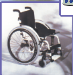
รถนั่งช่วยตนเอง