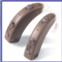
เครื่องช่วยฟังแบบต่างๆ