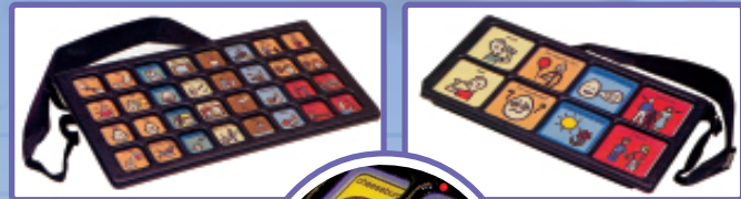
เครื่องช่วยสื่อสารสำหรับผู้พิการทางการสื่อความหมาย